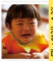
泣く、泣きつ面 なな、ななつら